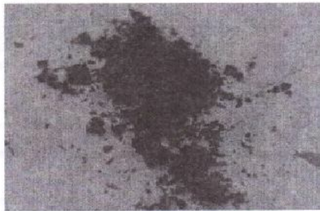
Рис. 1. Зола после сжигания брикета из опилок

После определения влажности брикета, проведен эксперимент по определению зольности. Произведены замеры массы тигеля с измельченным брикетом, тигеля с остатком после эксперимента и масса самого тигеля. Подставив значения в формулу (2) была определена зольность брикета, которая равна 1,6 %.